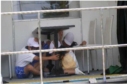
↓起震車による地震体験

当日は、石崎副市長さん、米川市議会議長さん、銚田市消防団大洋師団の8・9・10の分団、銚田市消防団女性部、銚田消防署、防災施設関係の業者の方々が集まり、計画どおりに訓練を実施しました。学校の敷地環境もあり、はしご車やヘリコプターによる訓練はありませんでしたが、通報訓練、地震による避難、教職員による屋内消火栓を使った放水、実際の火事による想定した全児童による水消火器や代表児童による消火器での炎の消火なども体験しました。